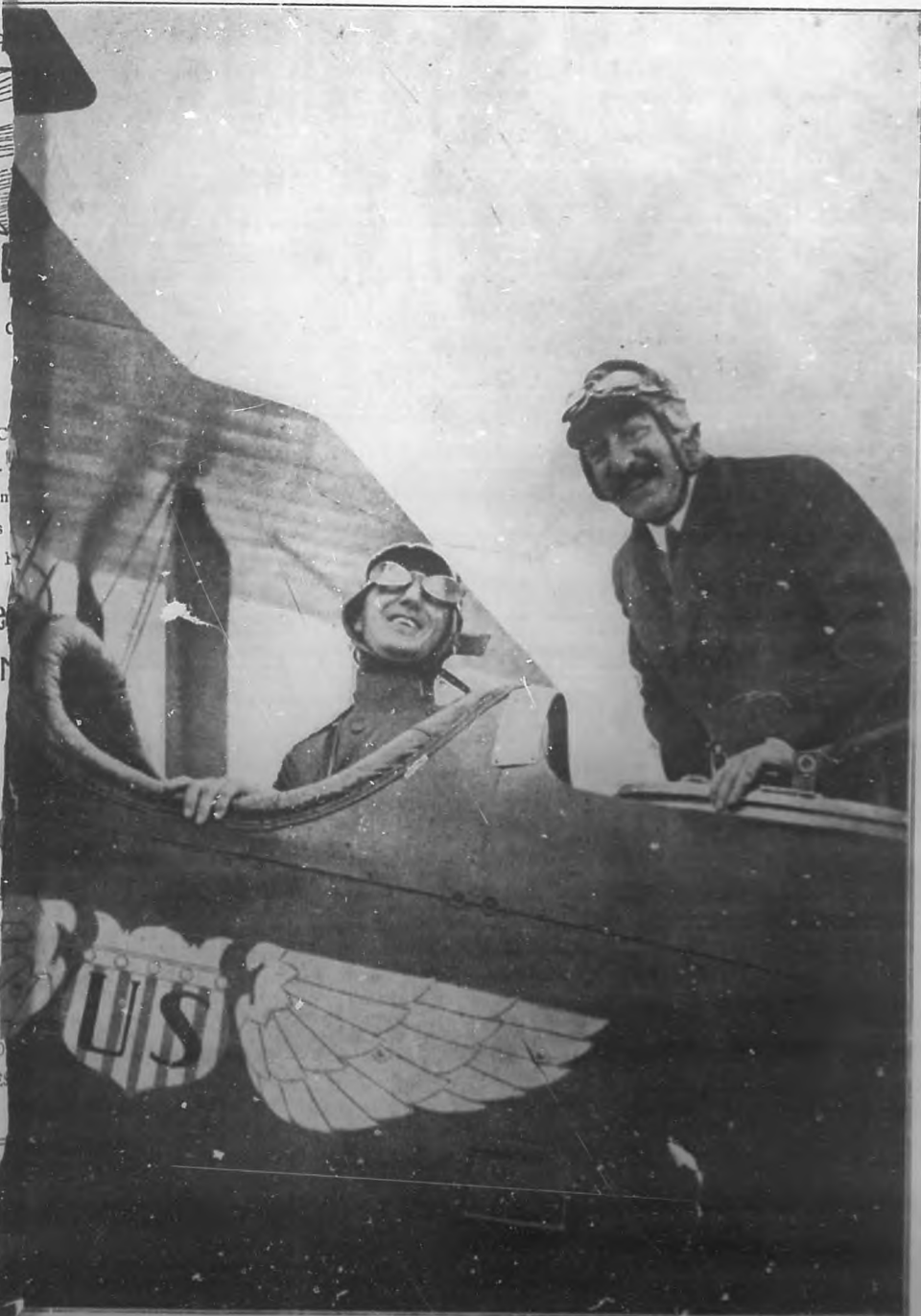
LA AVIACION AMERICANA SOBRE EL RHIN