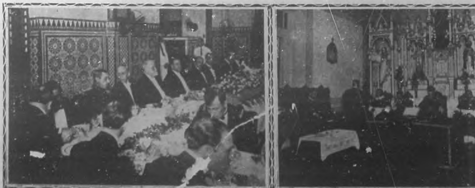
Presidencia del banquete ofrecido en el hotel "Inglaterra", a los jefes y oficiales de la fragata argentina "Sarmiento".