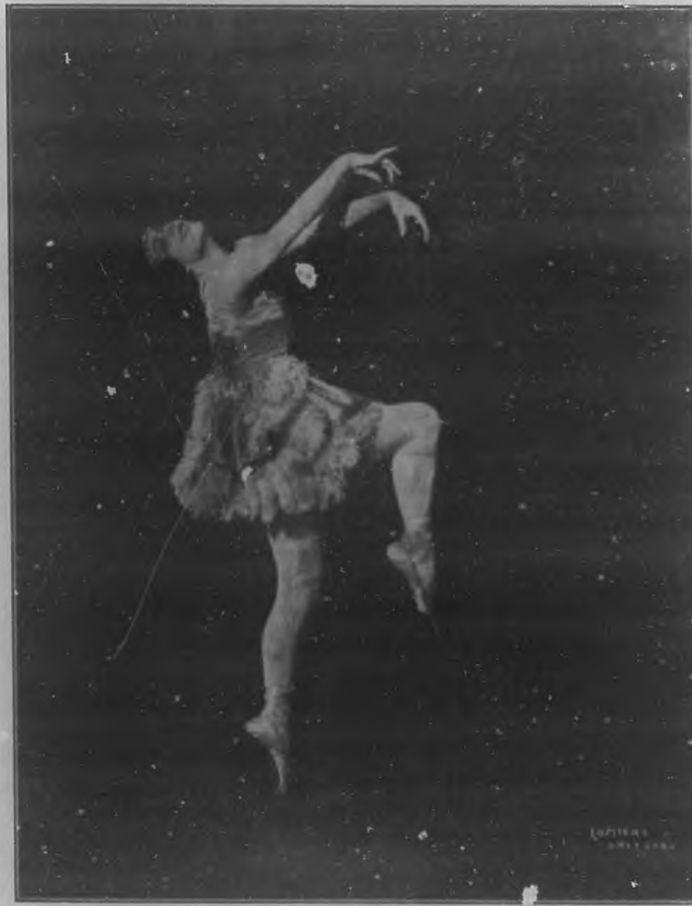
Una de las "Four Roses" bailarinas acrobáticas del "Hipódromo" de New York, que actúan en el "Nacional", con el circo "Pubillonos."