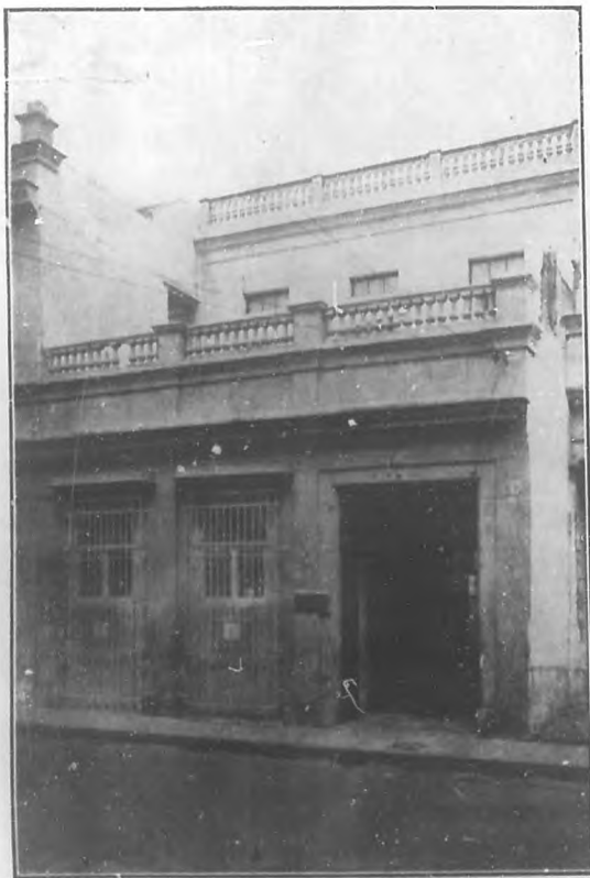
Fachada de la casa número ocho de la calle de Refugio, donde murió Mendive.

Oh, son! oh vez! Tu música armonía, Del cielo se desprende en leves giros,